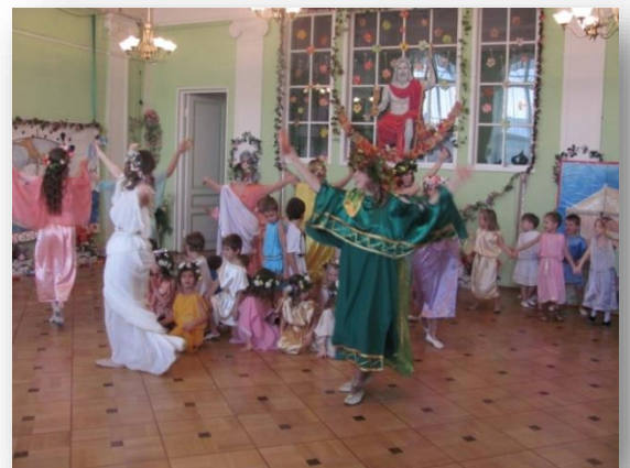
Зажигательно танцевали «Тарантеллу» и «Сиртаки»