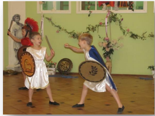
Юные эфебы исполнили военный танец «Перихий»