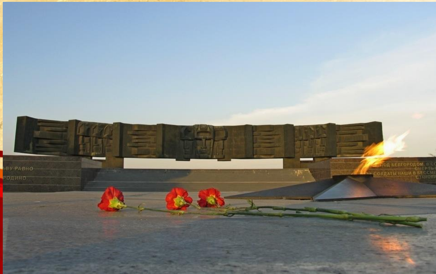
Мемориал Курская дуга

ТАК ПОБЕДОНОСНО ЗАВЕРШИЛАСЬ БИТВА НА КУРСКОЙ ОГНЕННОЙ ДУГЕ.