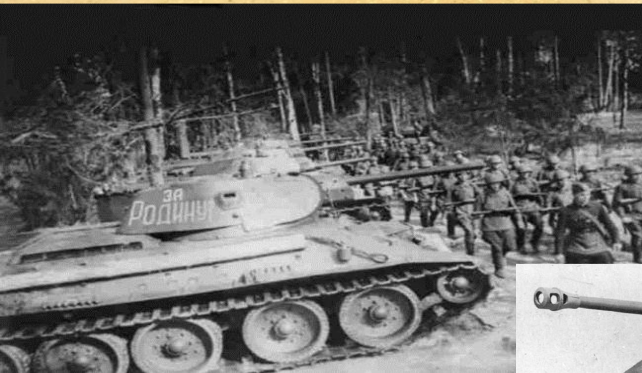
СОВЕТСКИЙ ТАНК «Т-34»

Окончательно похоронило гитлеровскую операцию «Цитадель» крупнейшее за всю вторую мировую войну встречное танковое сражение под Прохоровкой - 12 июля.