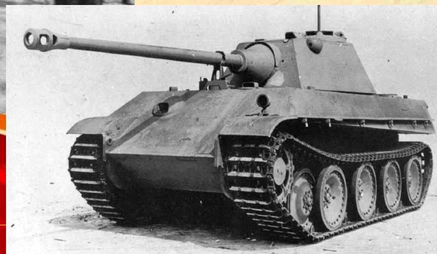
НЕМЕЦКИЙ ТЯЖЁЛЫЙ ТАНК «ПАНТЕРА»