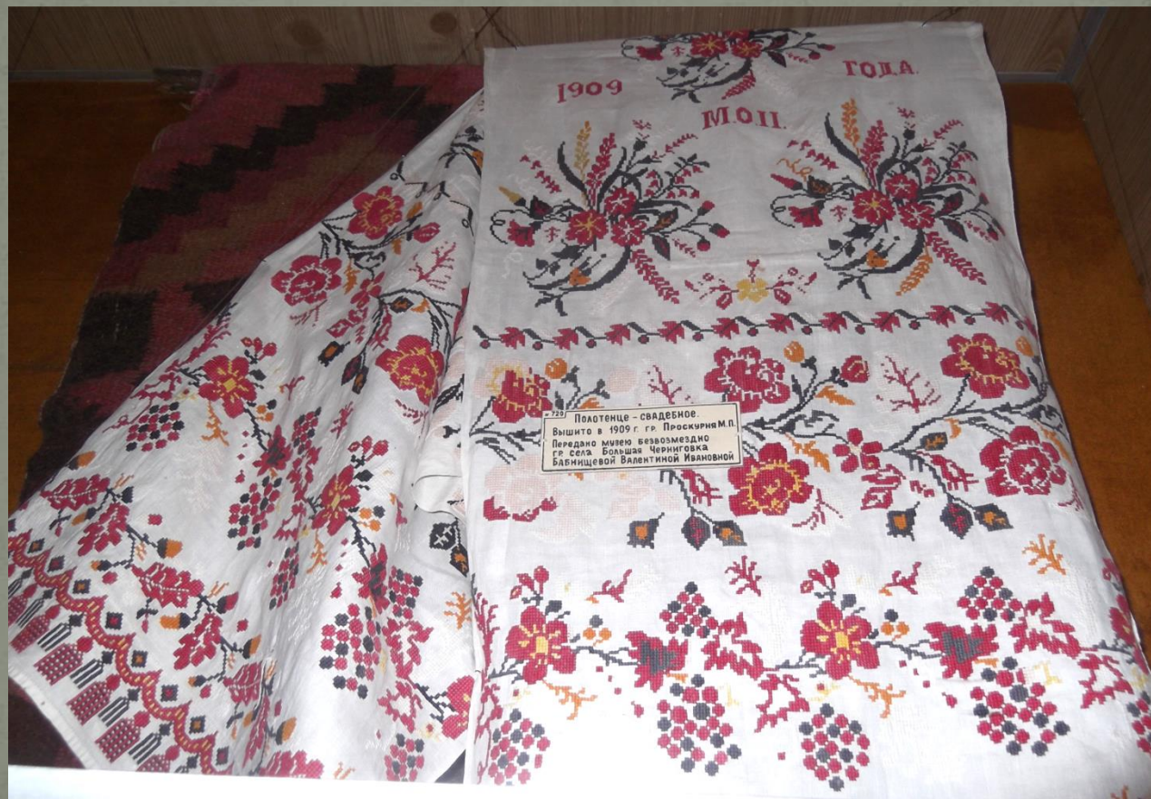
Полотенце свадебное. 1909 г.

В крестьянском быту украшением всего дома являлись нарядные полотенца с декоративными рисунками - рушники. Их украшали вышивкой и кружевами. Рушники широко использовались в различных обрядовых ситуациях, одной из которых является свадьба.