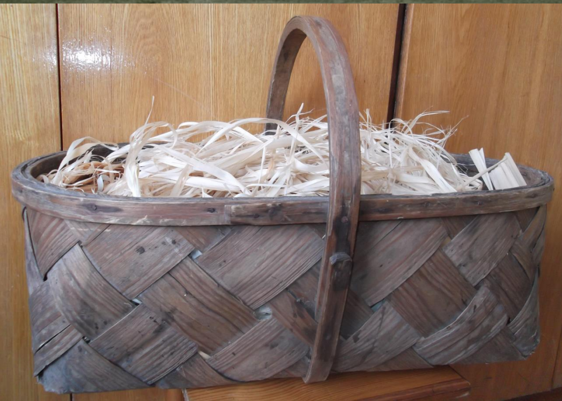
Корзина-лукошко из бересты