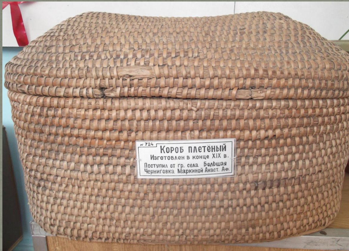
Короб, плетёный из лыка.

Используя природные материалы, наши предки создавали множество необходимых в быту предметов. Например, корзины и короба. В них обычно крестьяне хранили белье.