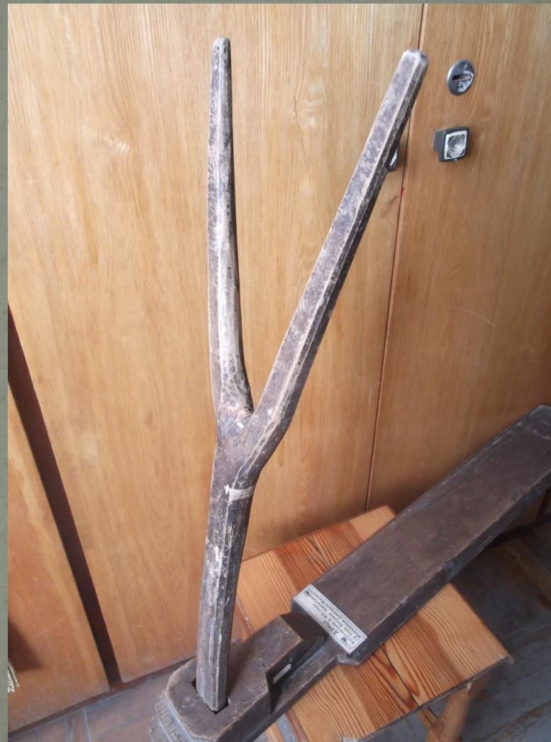
Прялка-донце (ручная прялка). Изготовлена в 1919 г.