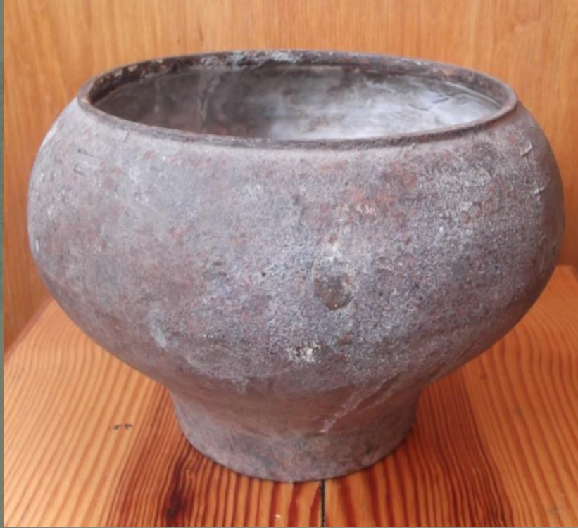
Чугунок Начало XX века.

Крестьянский дом трудно было представить без многочисленной утвари, накапливавшейся десятилетиями, и буквально заполнявшей пространство. Чтоб накормить семейство, хозяйки готовили еду в растопленных печах, в глиняных горшках, а позже – в чугунах, которые были разных размеров.