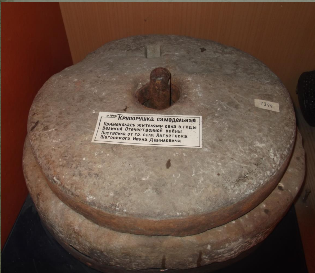
Крупоружка самодельная (из камня)