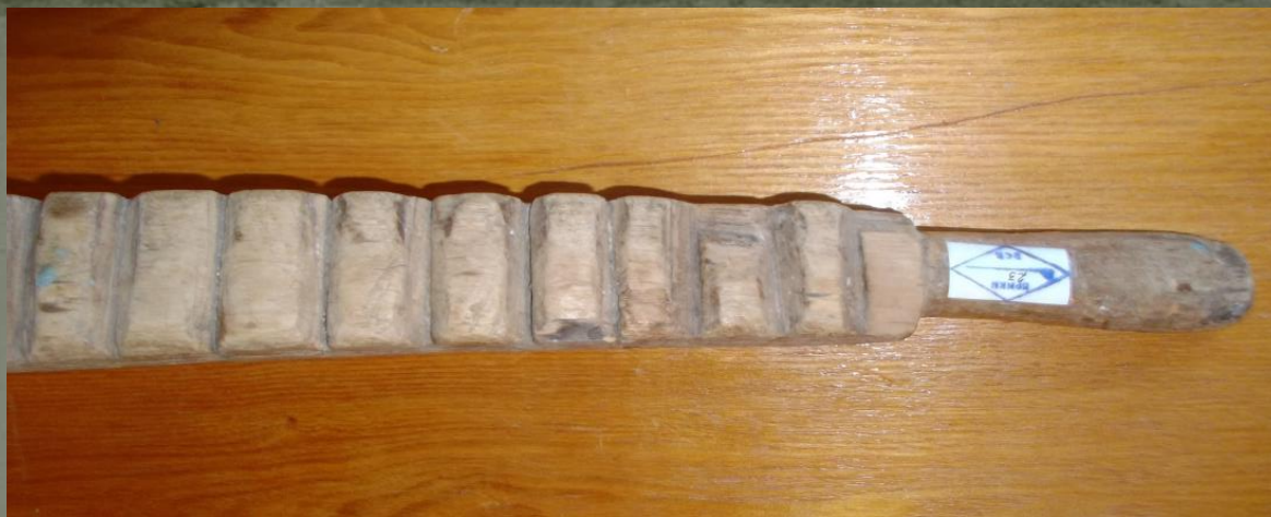
Рубель и скалка для глажки белья