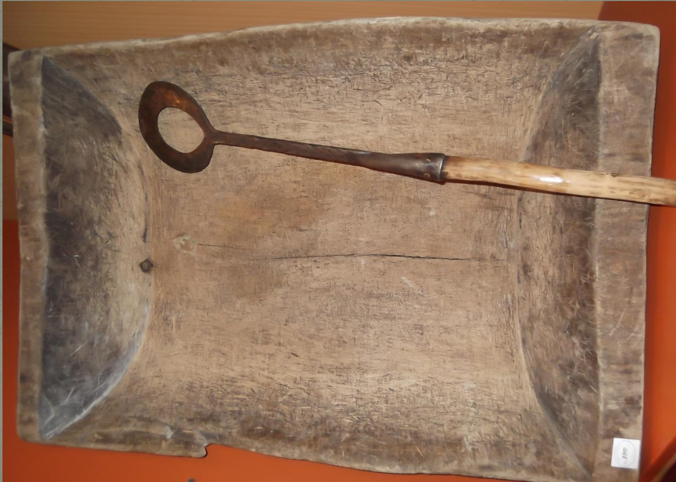
Корыто и тятка для рубки овощей. Начало XX века.

Одним из важных предметов домашней утвари было деревянное корыто. В нем при помощи тятки (сечки) рубили капусту и другие овощи.