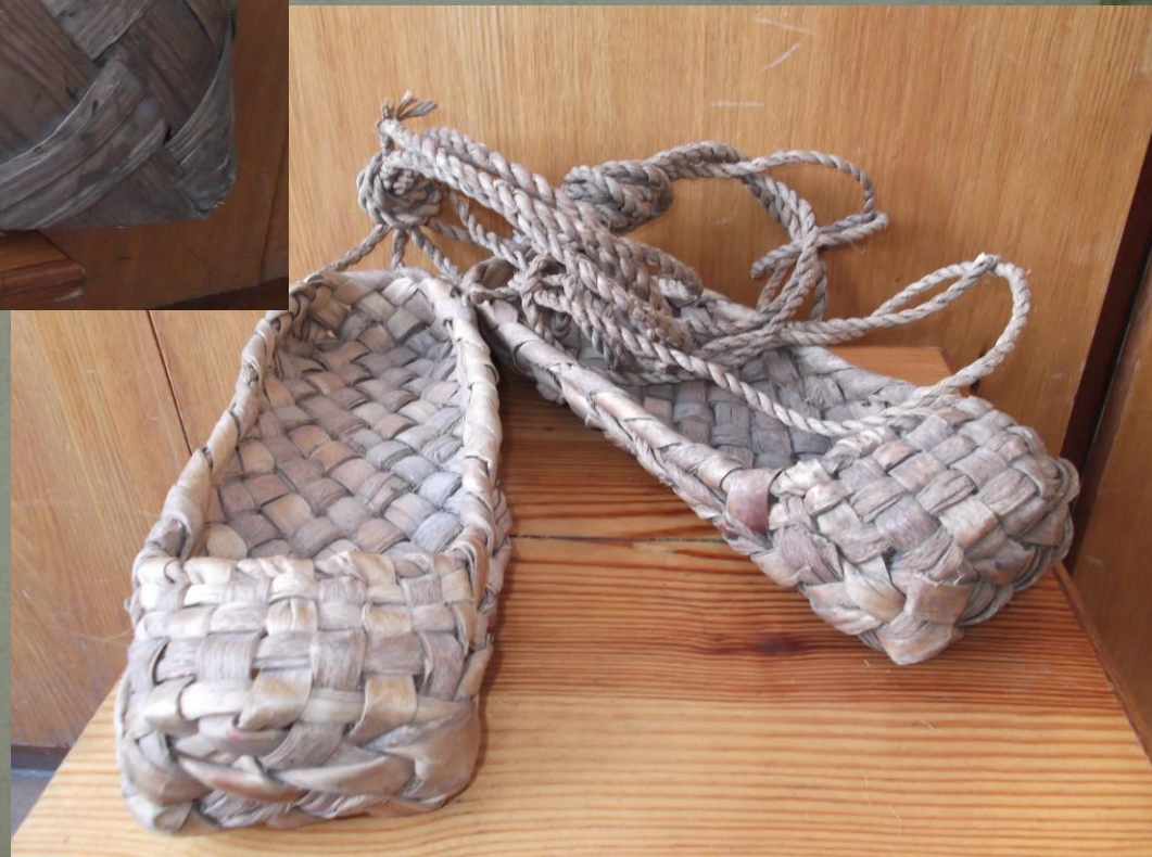
Лапти из лыка