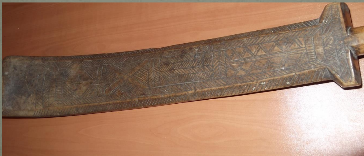
Обратная сторона рубеля, украшенная резьбой