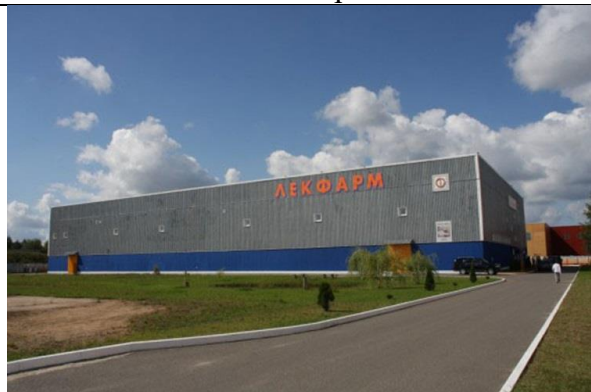
Фармацевтическое предприятие СООО «Лекфарм»