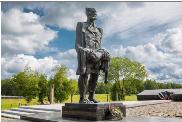
Мемориальный комплекс «Хатынь»