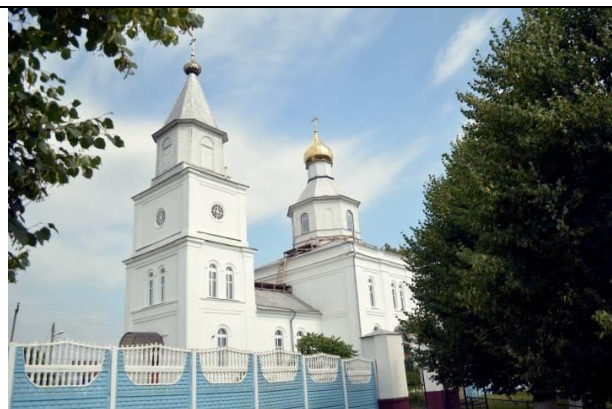
Свято-Николаевская церковь в Логойске