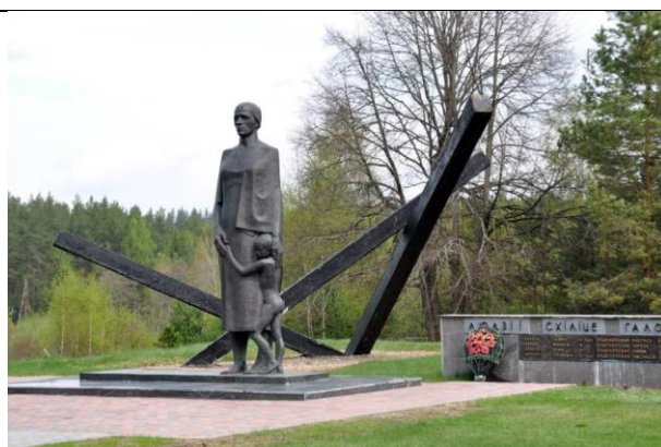
Мемориальный комплекс «Дальва»