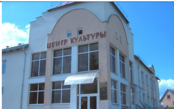
Логойский историко-краеведческий музей им. Константина и Евстафия Тышкевичей