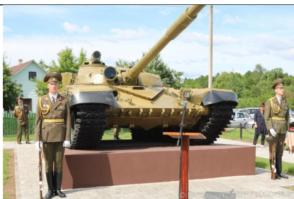
Мемориальный памятник в честь освобождения г.п. Плещениц от немецко-фашистских захватчиков