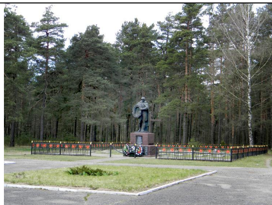
Братское кладбище в г.п. Плещеницы