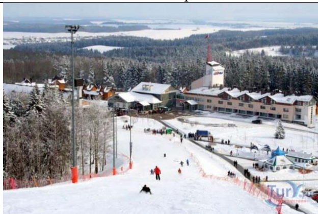
Республиканский горнолыжный центр «Силичи»