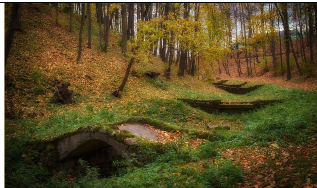
Приусадебный парк Тышкевичей в Логойске