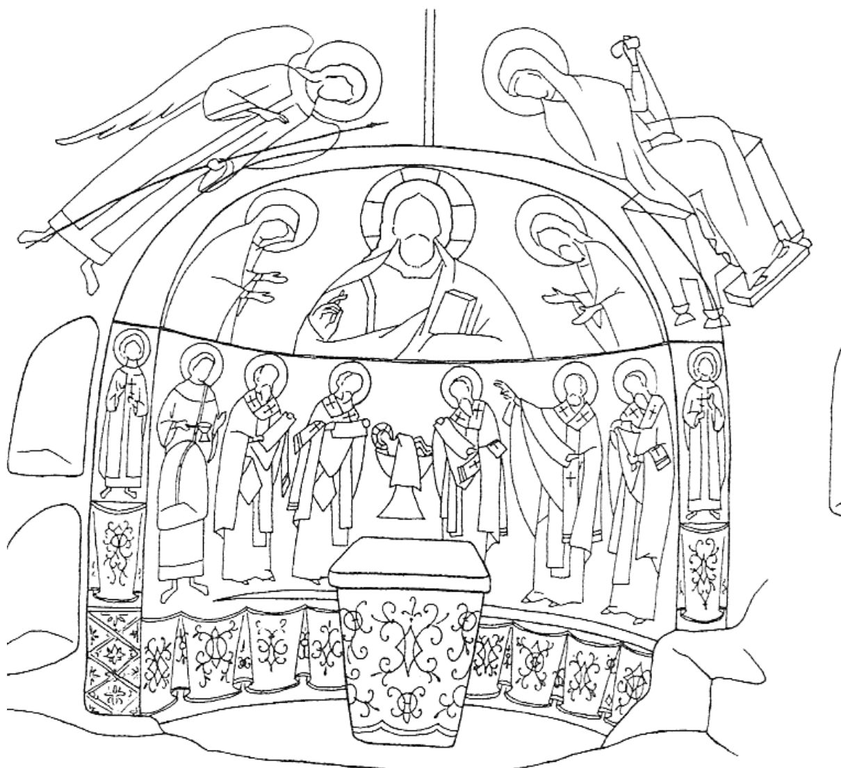
Роспись алтарной части храма Донаторов. Схема-реконструкция, выполненная И.Г. Волконской в 2002 г

В отличие от античного искусства раннесредневековым произведениям был присущ отказ от реалистической трактовки мира, место которой являли символы, бывшие носителем информации для христианского сообщества. То, что нам, современникам, может казаться примитивом, на самом деле являлось главным инструментом выражения эстетических и идеологических воззрений того времени, которые вели к трансцендентальному воспроизведению духовных ценностей и изображению христианского идеала методами изобразительного искусства.