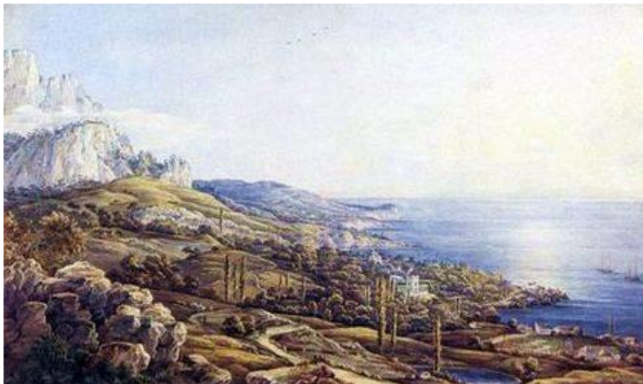
Чернецов Н.Г. Крым. Вид Ореанды. 1833

Первое упоминание о местечке Ореанда встречается у генуэзцев в XIV веке и носит описательный характер, как часть капитанства Готии.