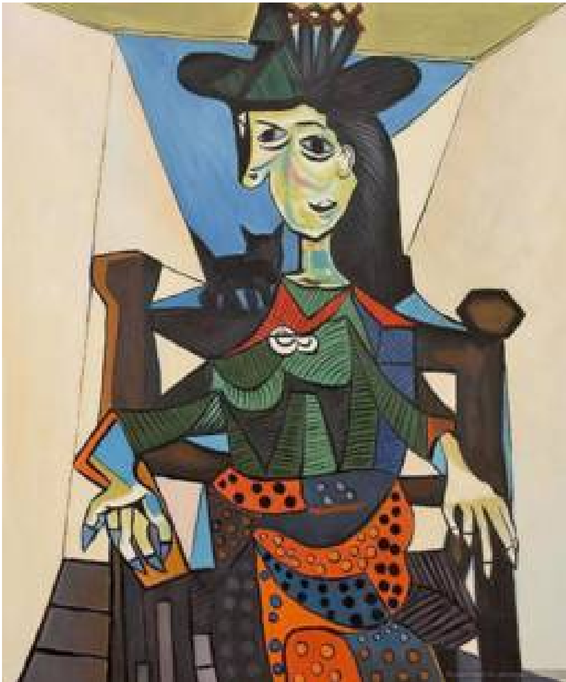
Портрет Доры Маар с кошкой. 1941. Пабло Пикассо