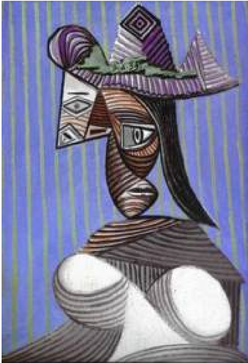
Женщина в разорванной шляпе. 1939. Пабло Пикассо