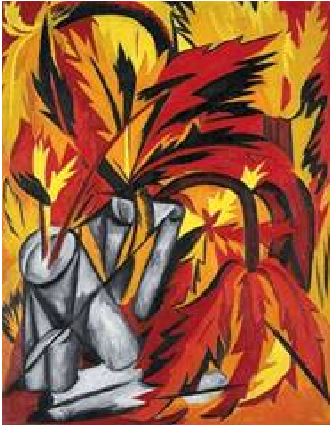
Цветы. 1912. Продана на аукционе Christie`s за 10.9 млн.$