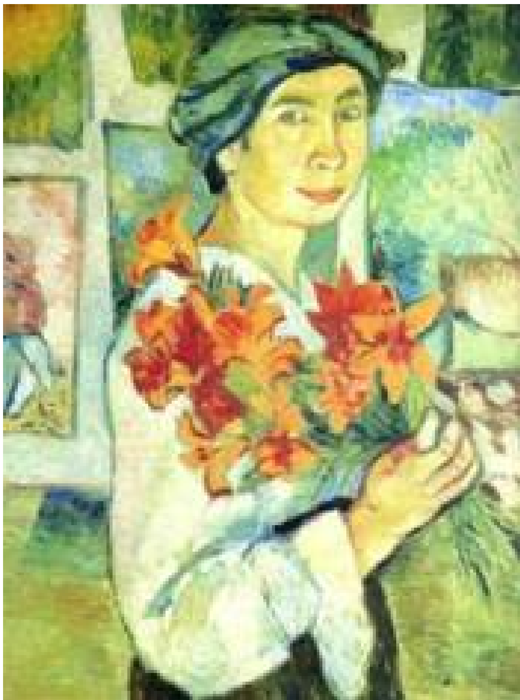
Автопортрет с лилиями. Наталья Гончарова