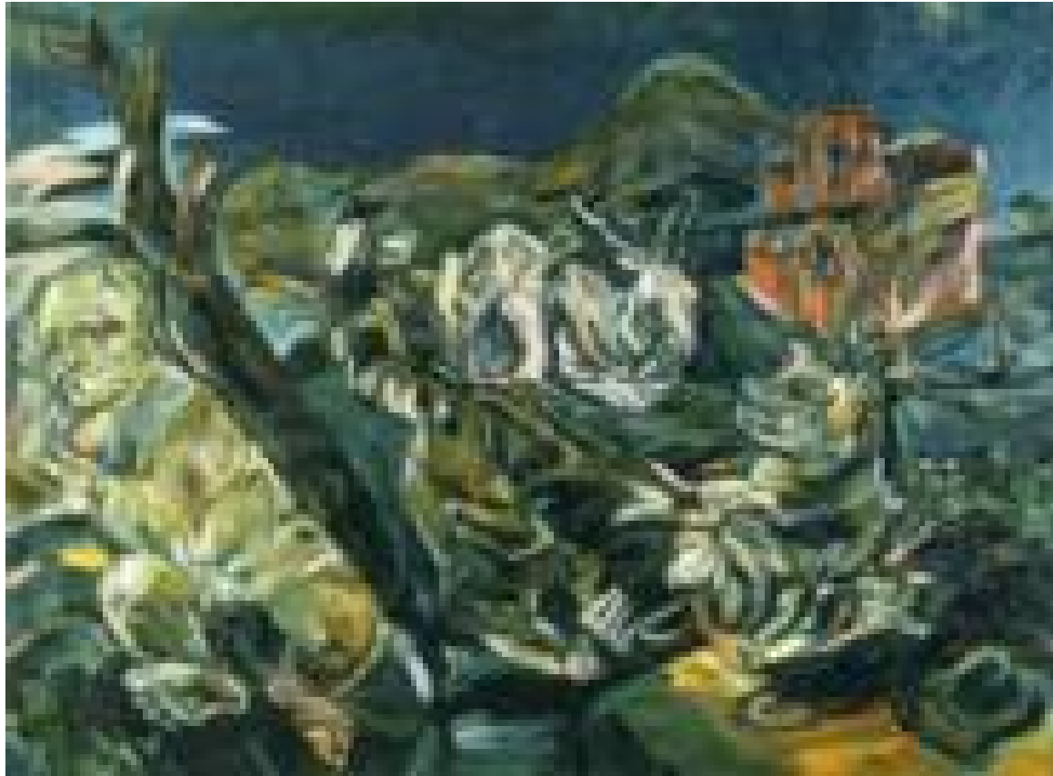
Bodegon with Affair and Rabbit. 1914