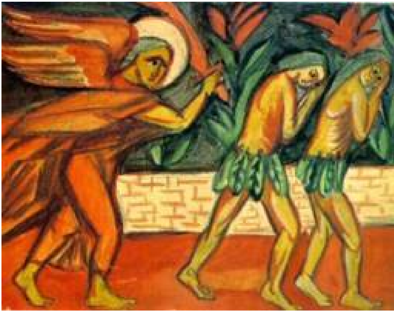
Изгнание из рая