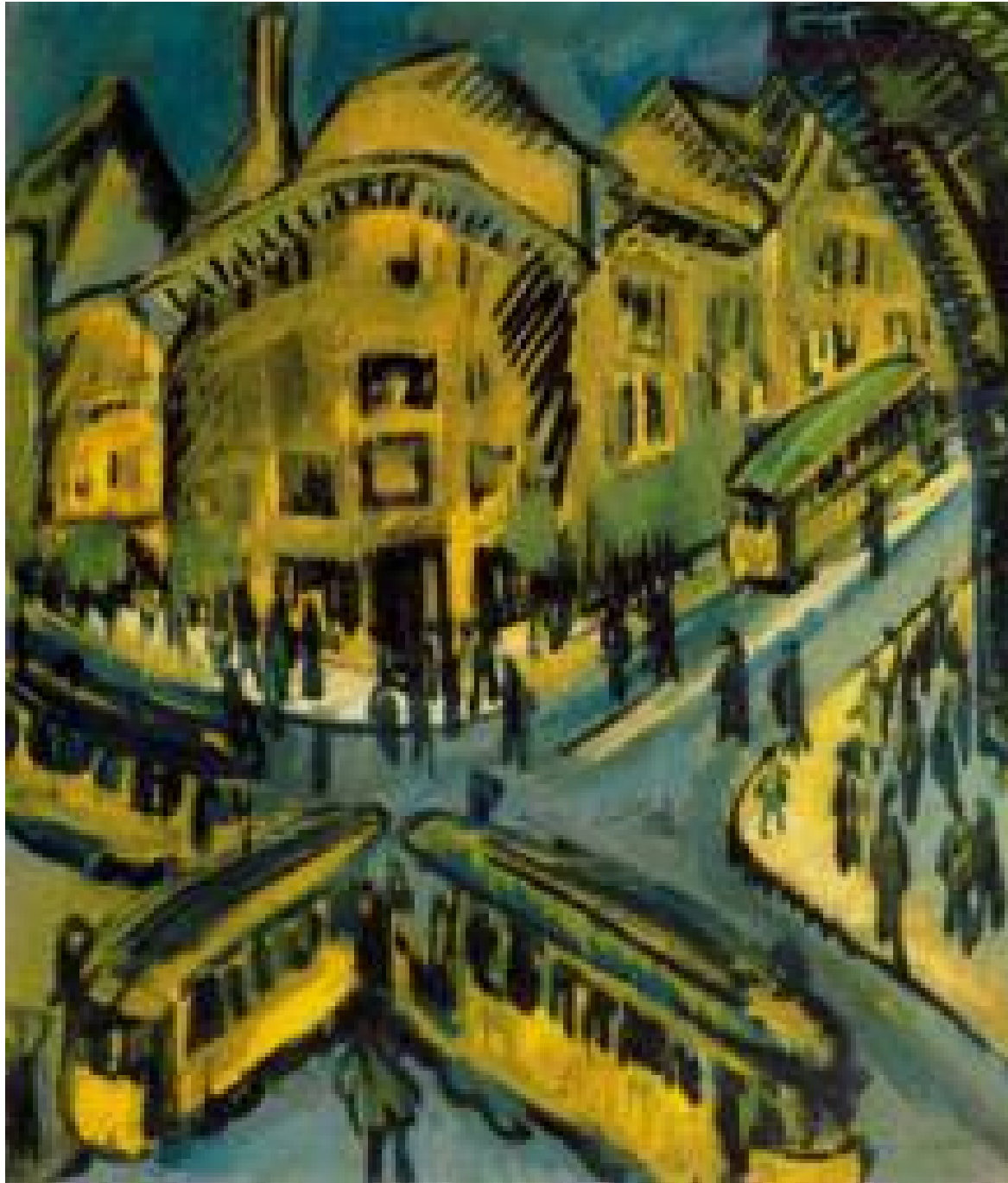
Эрнст Людвиг Кирхнер