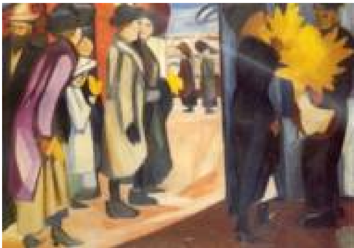
Весна в городе