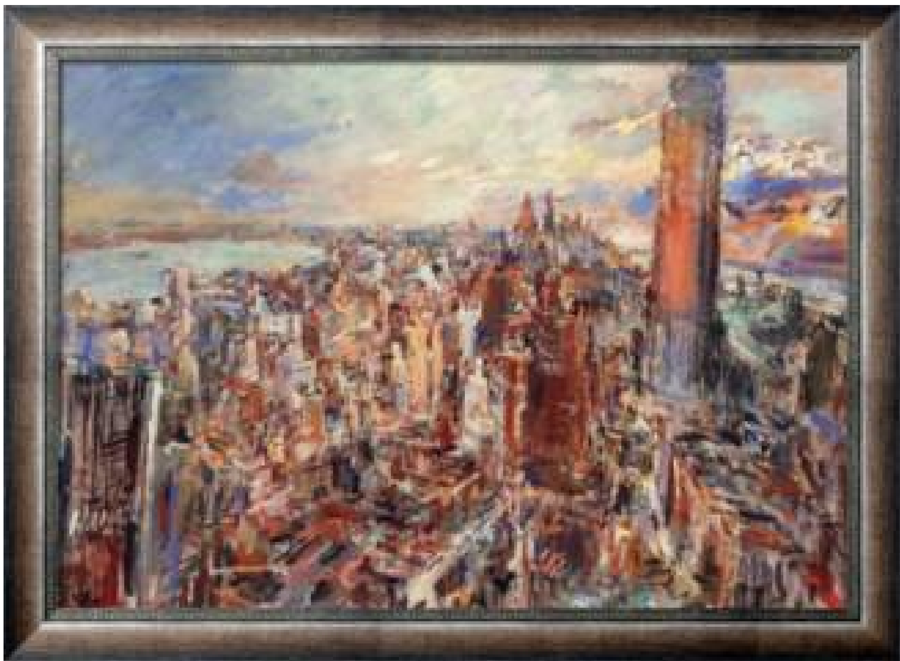
Лондон по Темзе