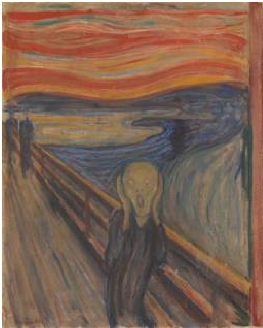
Крик (1893). Эдвард Мунк

Экспрессионизм возник как острейшая, болезненная реакция на уродства цивилизации начала 20 века, Первую мировую войну и революционные движения. Поколение, травмированное бойней мировой войны воспринимало действительность крайне субъективно, через призму таких эмоций, как разочарование, тревога, страх . Очень распространены мотивы боли и крика .