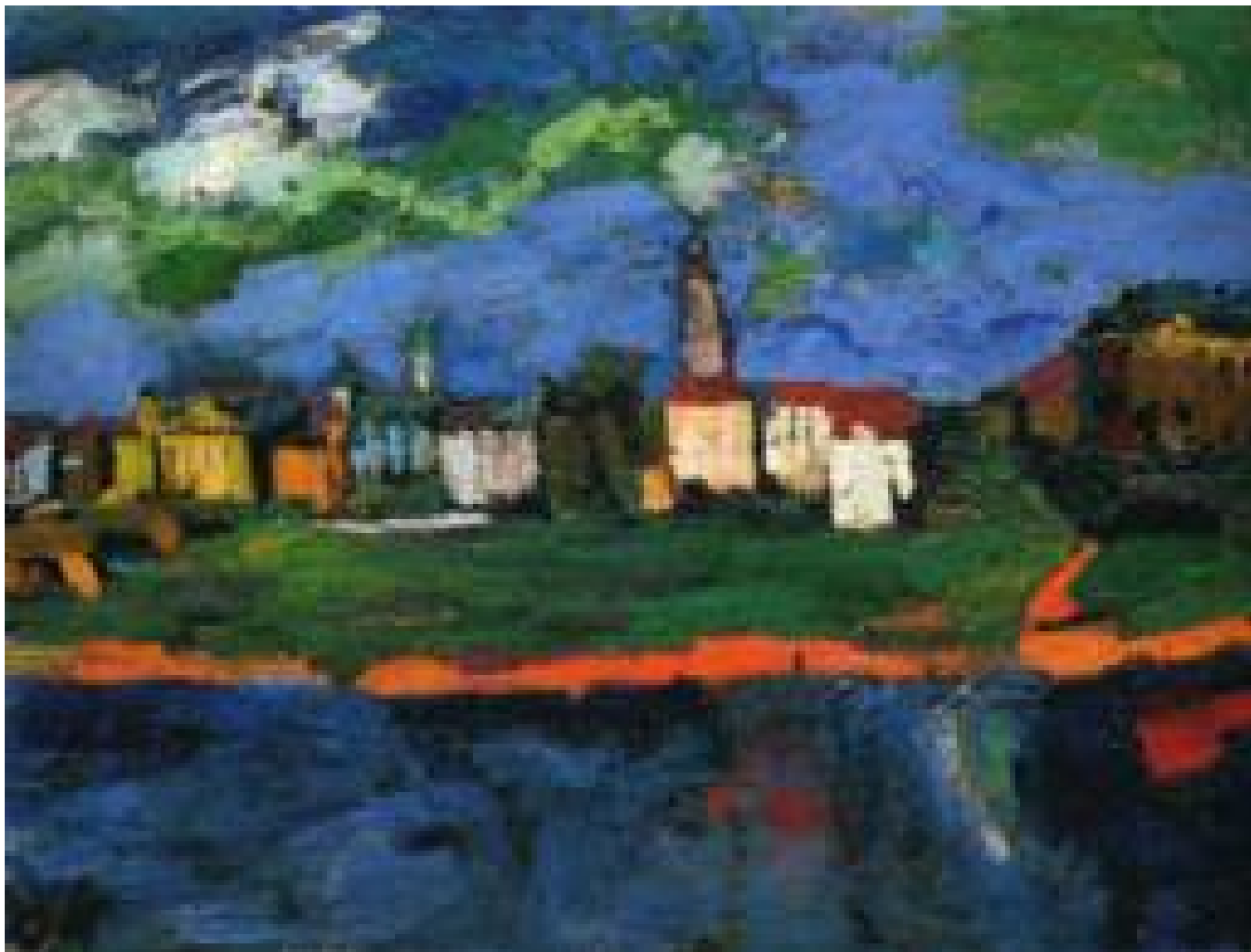
Эльба возле Дрездена