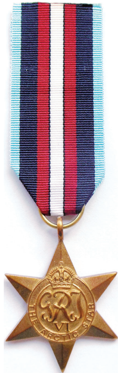
Ил. 47. Арктическая звезда. Лицевая сторона