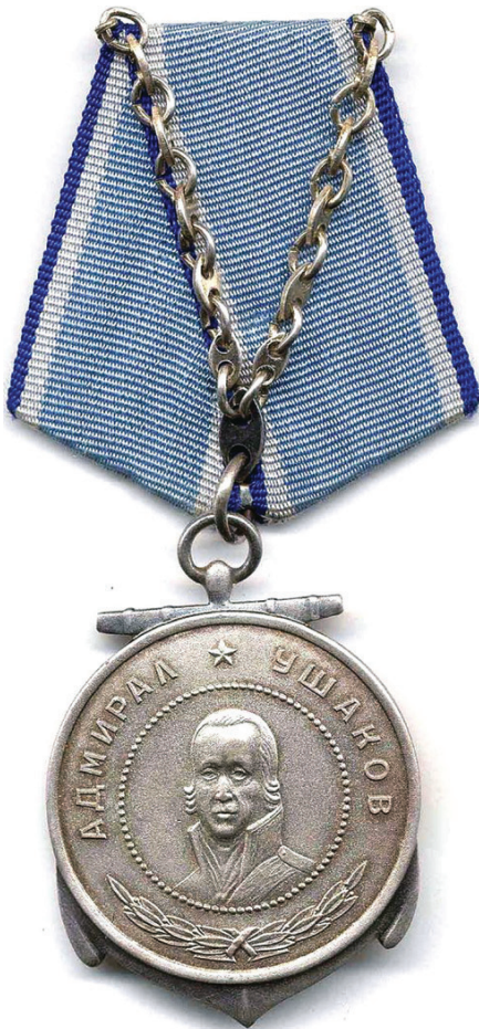
Ил. 46. Медаль Ушакова. Лицевая сторона