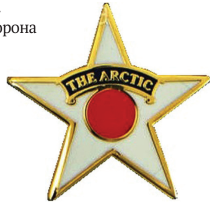
Ил. 45. Арктическая эмблема. Лицевая сторона.