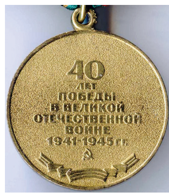
Ил. 39. Юбилейная медаль «Сорок лет Победы в Великой Отечественной войне 1941–1945 гг.». Обратная сторона вариант без надписи.