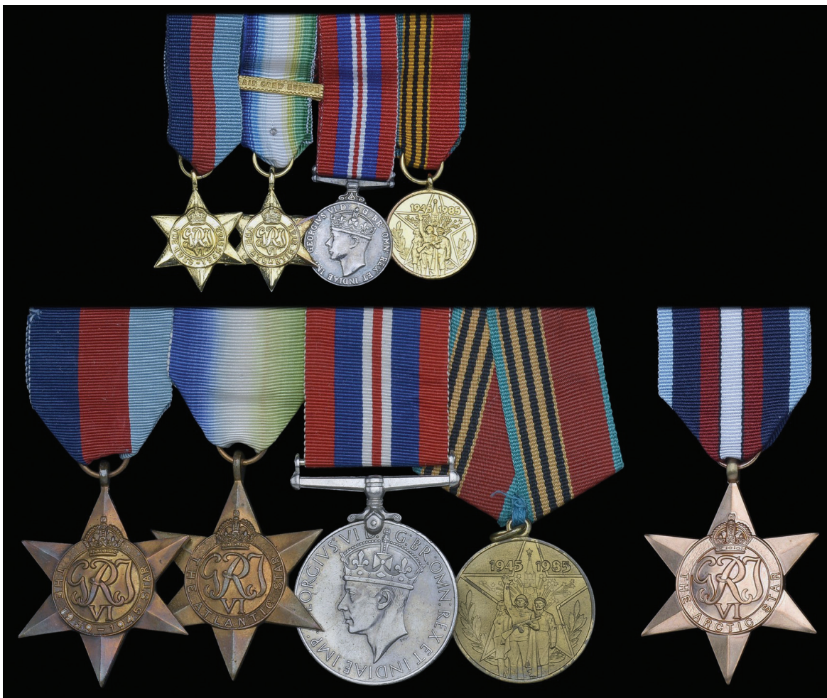
Ил. 48. Награды Чарльза Фредерика Гофа (Charles Frederick Gough)