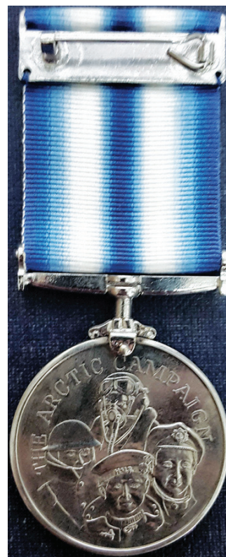
Ил. 41. The Arctic Campaign Medal – for service in the Arctic Zone 1939–1945. Обратная сторона