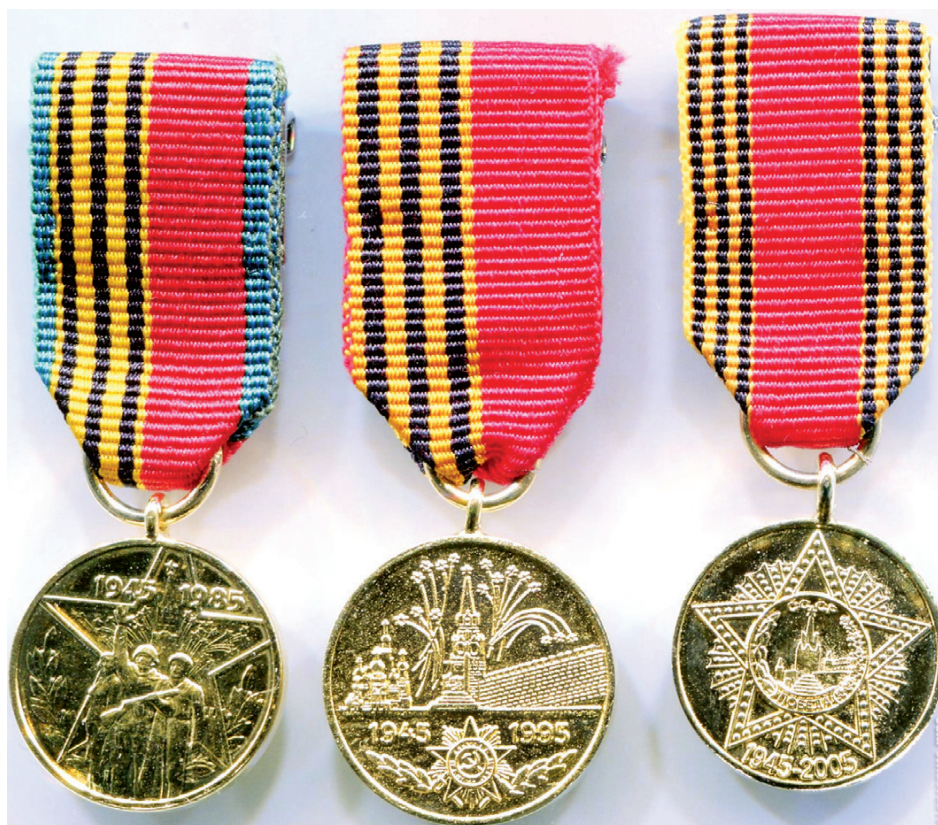
Ил. 43. Фрачные миниатюры медалей к 40, 50 и 60-летию Победы, изготовленные для участников Северных конвоев. Производство фирмы «Award Productions Ltd», Великобритания