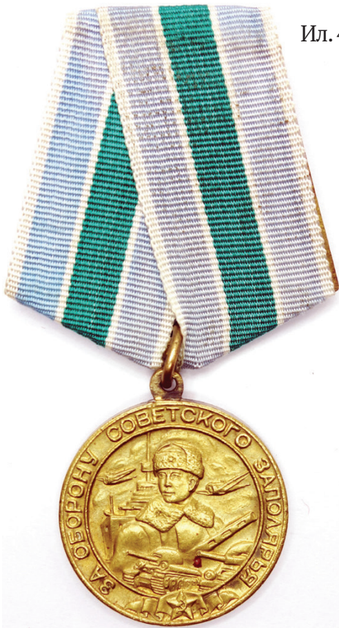
Ил. 44. Медаль «За оборону Советского Заполярья». Лицевая сторона