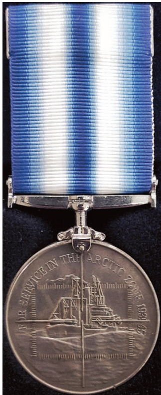
Ил. 40. The Arctic Campaign Medal – for service in the Arctic Zone 1939–1945. Лицевая сторона