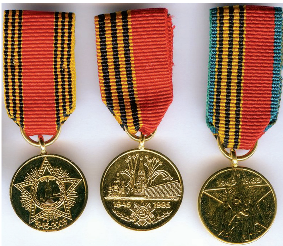
Ил. 42. Фрачные миниатюры медалей к 40, 50 и 60-летию Победы, изготовленные для участников северных конвоев. Производство фирмы «Award Productions Ltd», Великобритания.