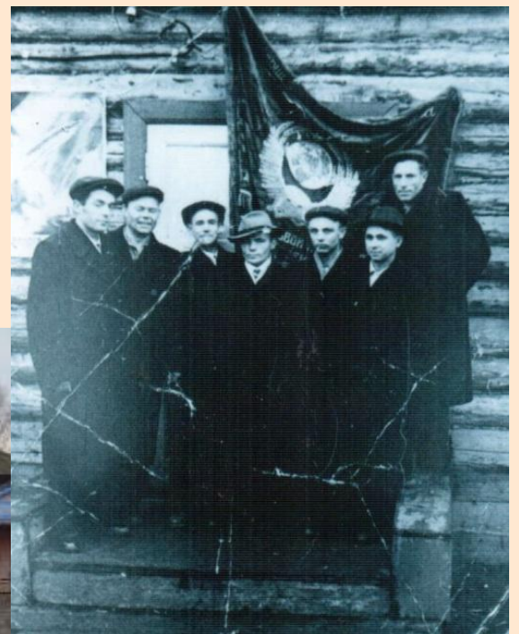
Кино будкасы алды