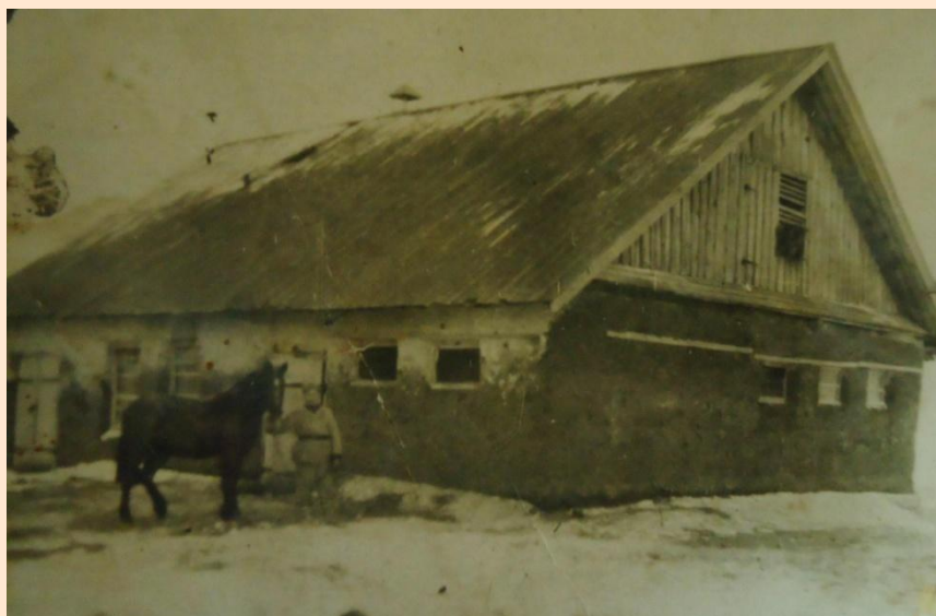
Колхозның каланча бинасы

Күмәкләштерү башлангач, Тәмәй авылында да «Кустарь» колхозы оеша. Авыл 70-80 хужалыктан торган. Күмәк хужалык бай һәм алдынгылардан саналган.