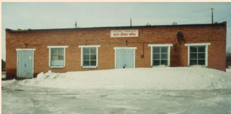
Мәмәшир һәм Тәмәй пекарнялары