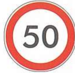
ОГРАНИЧЕНИЕ МАКСИМАЛЬНОЙ СКОРОСТИ