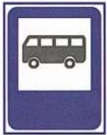
МЕСТО СТОЯНКИ АВТОБУСА, ТРОЛЛЕЙБУСА