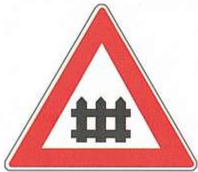
ЖЕЛЕЗНОДОРОЖНЫЙ ПЕРЕЕЗД СО ШЛАГБАУМОМ