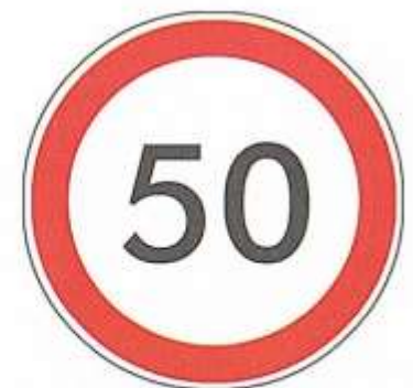
ОГРАНИЧЕНИЕ МАКСИМАЛЬНОЙ СКОРОСТИ