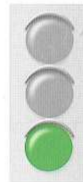
ЗЕЛЕНый СИГНАЛ СВЕТОФОРА