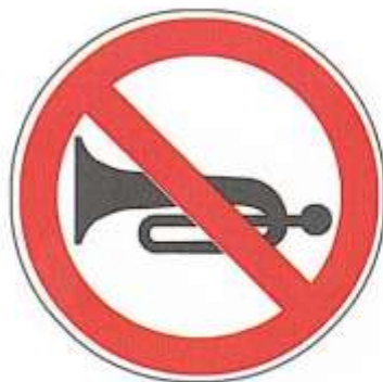
ПОДАЧА ЗВУКОВОГО СИГНАЛА ЗАПРЕЩЕНА