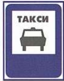
МЕСТО СТОЯНКИ ТАКСИ