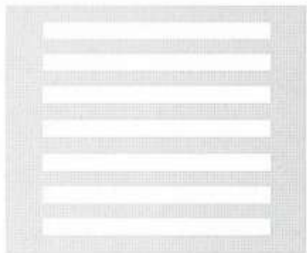
ПЕШЕХОДНЫЙ ПЕРЕХОД (ДОРОЖНАЯ РАЗМЕТКА)