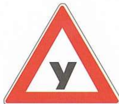
УЧЕБНОЕ ТРАНСПОРТНОЕ СРЕДСТВО