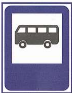
МЕСТО СТОЯНКИ АВТОБУСА, ТРОЛЛЕЙБУСА