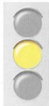
ЖЕЛТЫЙ СИГНАЛ СВЕТОФОРА