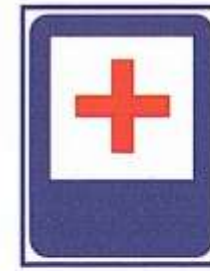
ПУНКТ ПЕРВОЙ МЕДИЦИНСКОЙ ПОМОЩИ