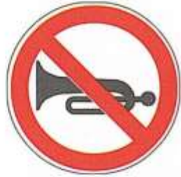
ПОДАЧА ЗВУКОВОГО СИГНАЛА ЗАПРЕЩЕНА