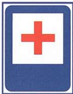
ПУНКТ ПЕРВОЙ МЕДИЦИНСКОЙ ПОМОЩИ