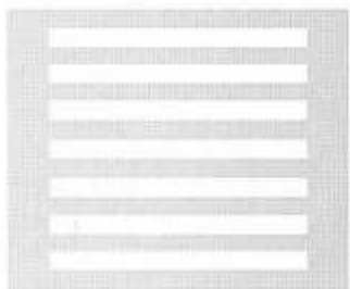
ПЕШЕХОДНЫЙ ПЕРЕХОД (ДОРОЖНАЯ РАЗМЕТКА)