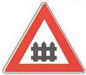
ЖЕЛЕЗНОДОРОЖНЫЙ ПЕРЕЕЗД СО ШЛАГБАУМОМ