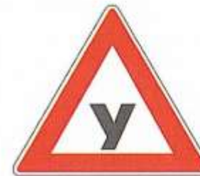
УЧЕБНОЕ ТРАНСПОРТНОЕ СРЕДСТВО