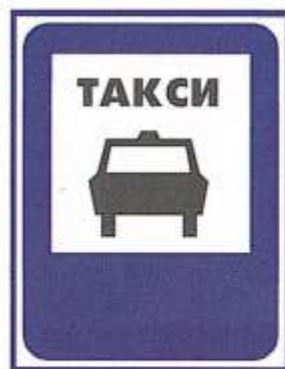
МЕСТО СТОЯНКИ ТАКСИ