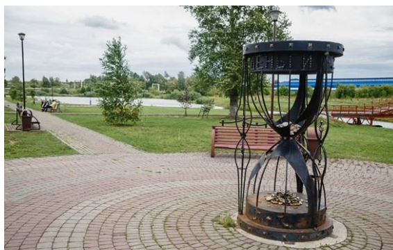
Скульптурная композиция ВРЕМЯ-ДЕНЬГИ

24 сентября 2015 года в Нижней части парка открыли новую скульптуру «Время — деньги». Архитектурная форма посвящена малому предпринимательству. Скульптура представляет собой металлические песочные часы, в которых главной единицей измерения времени являются деньги. Ее установили рядом с так называемым мостиком влюблённых, где молодожены вывешивают замки, в честь любви и преданности.